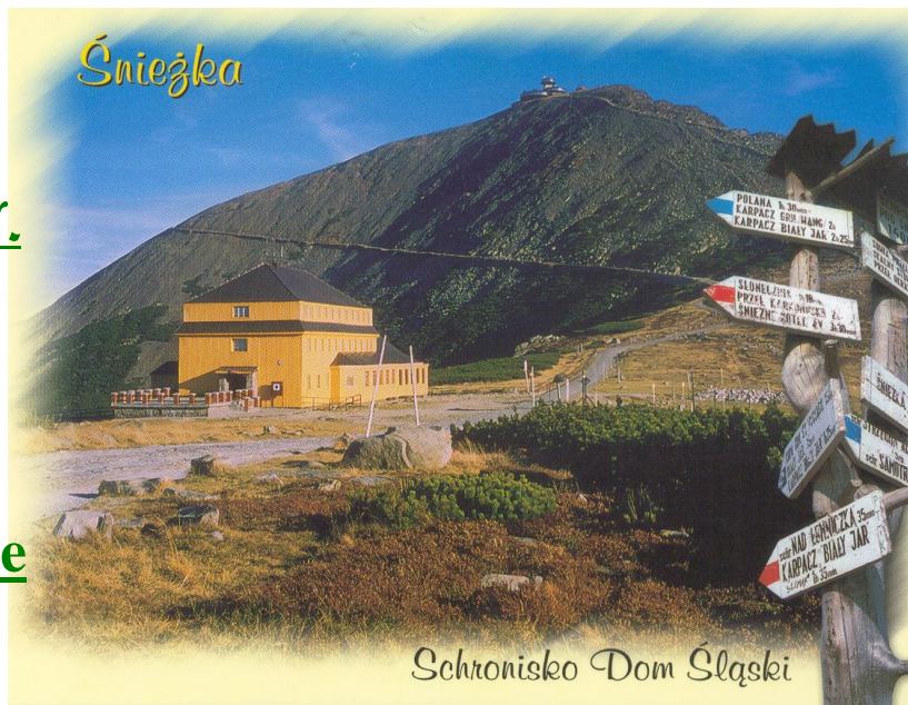
Schronisko Dom Śląski